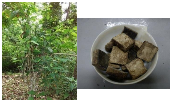
Gambar 1. (a). Tumbuhan gambir ( Uncaria gambir Roxb.), (b). Ekstrak padat gambir

*2-NF: 2-Nitrofluorene; †4-NQO: 4-Nitroquinoline N-oxide; ‡2AA: (2-Aminoantrasena)